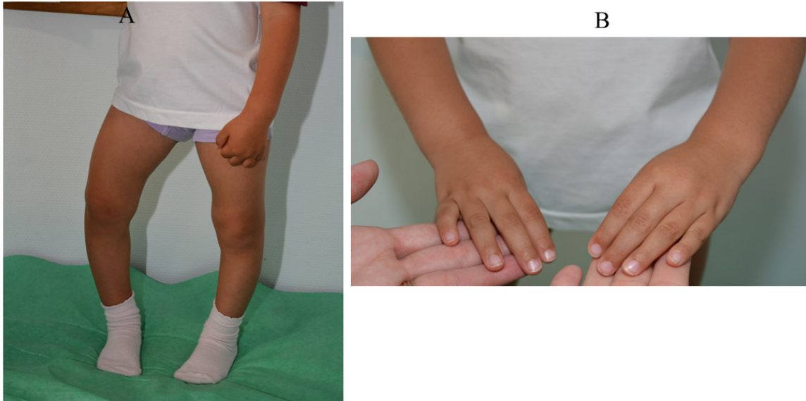
Figura 2. A. Arqueamiento de miembros inferiores. B. Aumento de las metáfisis de las muñecas

cefalia secundaria a craneosinostosis de una o más suturas que puede requerir craneotomía; el aplastamiento de la base craneal ocasiona una disminución de la profundidad de la fosa posterior que predispone a malformaciones tipo Chiari I en cerca de un 44% de los pacientes. También pueden presentar siringomielia. Estas malformaciones pueden originar dolor de cabeza, vértigo e hipertensión intracraneal [17] [18] [19]. Algunos niños pueden presentar alteración o retraso del desarrollo motor por afectación muscular tipo miopatía [20].