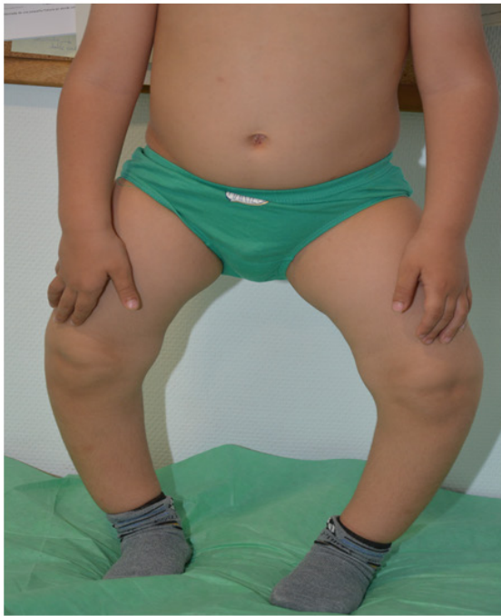
Figura 3. Mejoría de las deformidades óseas con tratamiento convencional.